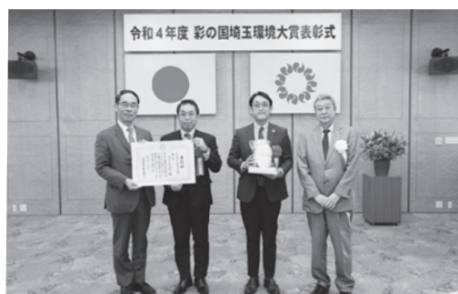
事業者部門 大賞受賞 株式会社 CRS 埼玉