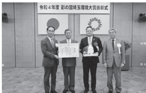
県民部門 大賞受賞 草加商工会議所