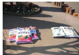
R5.2.9 花苗等 R5.2.18実施 花苗を植