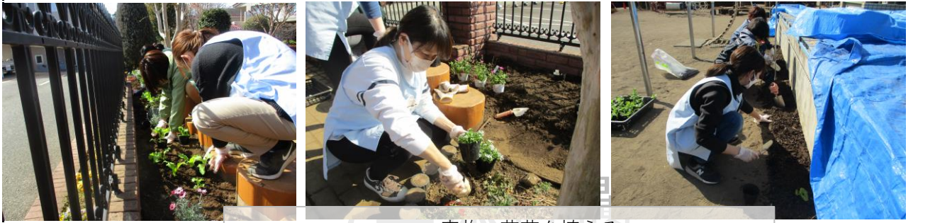
R5.2.18実施 花苗を植える