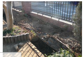
R5.1.7購入 丸太 R5.1.7~2.10実施 花苗を植える(花壇作り)