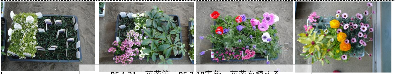
R5.1.31 花苗等 R5.2.18実施 花苗を植える