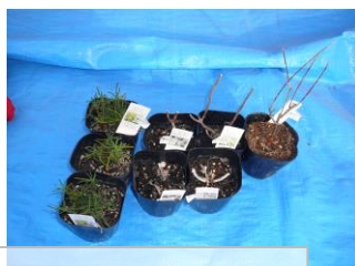
R5.2.5 花苗等 R5.2.18実施 花苗を植え